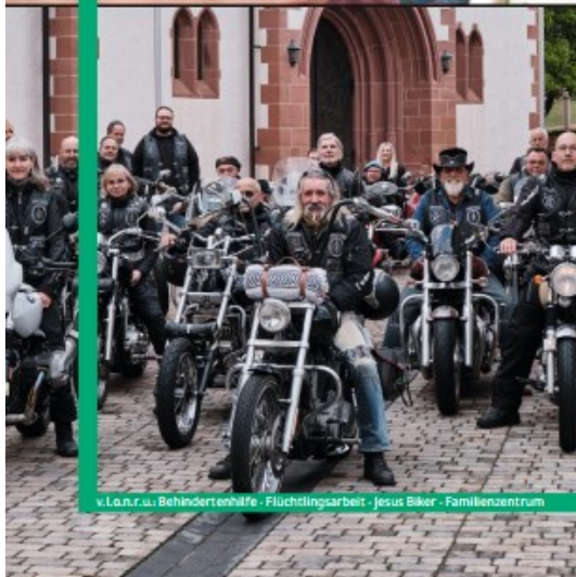
v.l.o.n.r.u.: Behindertenhilfe - Flüchtlingsarbeit - Jesus Biker - Familienzentrum